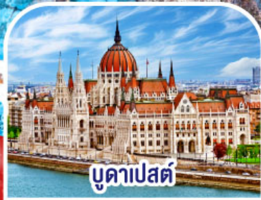
บูดาเปสต์

✓ พักอัลสตัด ✓ ขึ้นยอดเขาชุกสปีตซ์ TOP OF GERMANY