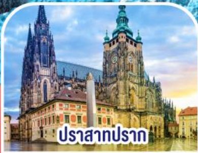
ปราสาทปราก