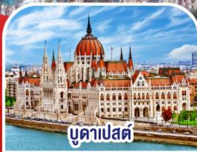
บูดาเปสต์

✓ พักอัลสตัด ✓ ขึ้นยอดเขาชุกสปีตซ์ เริ่มต้น TOP OF GERMANY