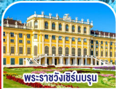
พระราชวังเชิร์นบรุน