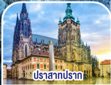
ปราสาทปราก