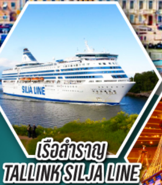
เรือสำราญ TALLINK SILJA LINE