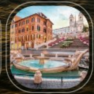
Italy Civitavecchia (Rome)

ราคาต่อคน : 175,900 บาท (รวมค่าเรือ, ค่าที่พักบนเรือ, ค่าอาหารกลางวันและอาหารค่ำ) | ราคาใบเรือ : ค่าค่าตัว, ค่าเครื่องดื่ม, ค่าสัมภาระ, ค่าประกัน