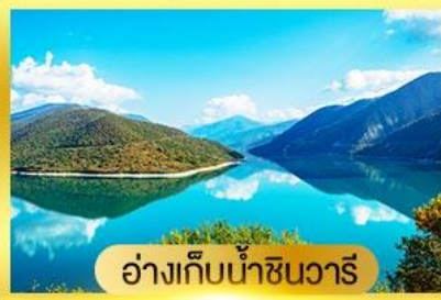
อ่างเก็บน้ำชินวารี