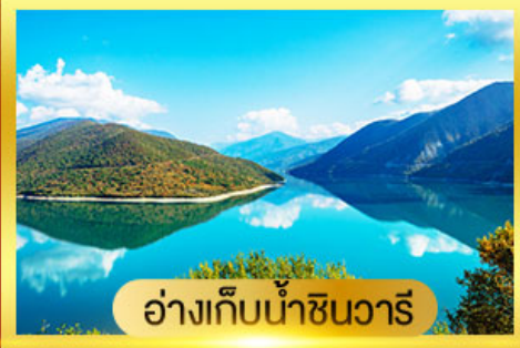
อ่างเก็บน้ำชินวาริ