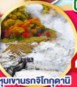
หุบเขานรกจิทอกุดานิ