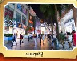
ถนนสินค้ายู