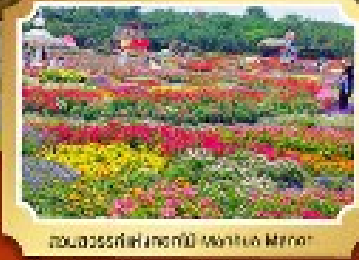
สวนสวรรค์ดอกไม้สีฤดู (Autumn Mirror)