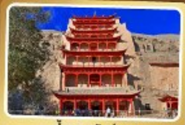
กำแพงสลักม่อเกา