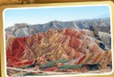
เวาสายรุ้งจากเย่