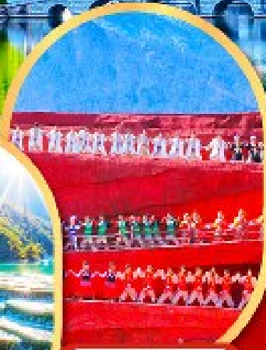
โชว์ Impression Lijiang