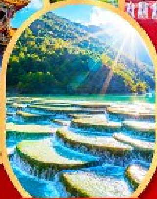
ภูเขาสีน้ำเงิน