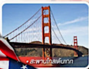
สะพานโกลเด้นเกต