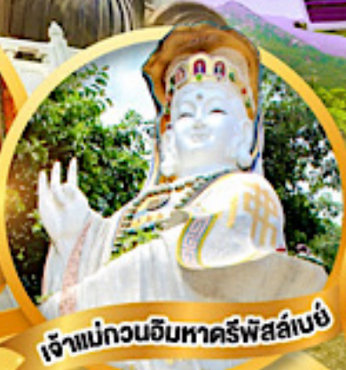
เจ้าแม่กวนอิมหาครีพีส์ลีย์