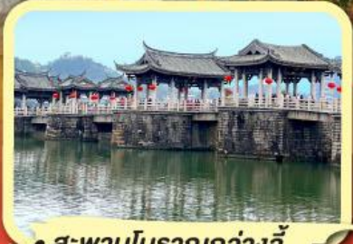
• สะพานโบราณกว้างจี้