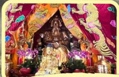
• เอียงบู๊ซัว (ศาลเจ้าพ่อเสือ)