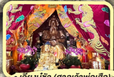
• เอียงบู๊ซิว (ศาลเจ้าพ่อเสือ)