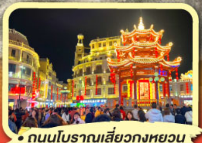
• ถนนโบราณเสี่ยวกงหยวน