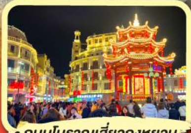
• ถนนโบราณเสี่ยวกงหยวน