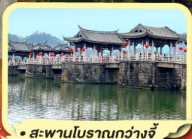
• สะพานโบราณกว้างจี้