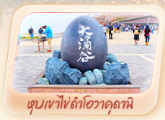
ซุบเขาโซด้าโอวาคุดานิ