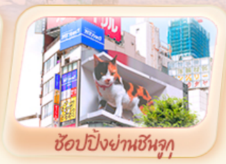
ช้อปปิ้งย่านชินจูกุ