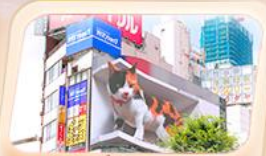
ช้อปปิ้งย่านชินจูกุ