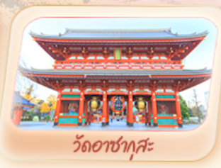
วัดฮาซากุสะ