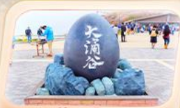
ชุมชนไร่ดำโอวาคุดานิ

สายการบิน AirAsia X (XJ) น้ำหนักกระเป๋า 20 KG