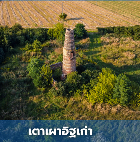
เตาเผาอิฐเก่า