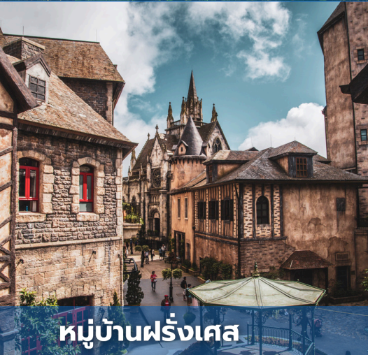
หมู่บ้านฝรั่งเศส