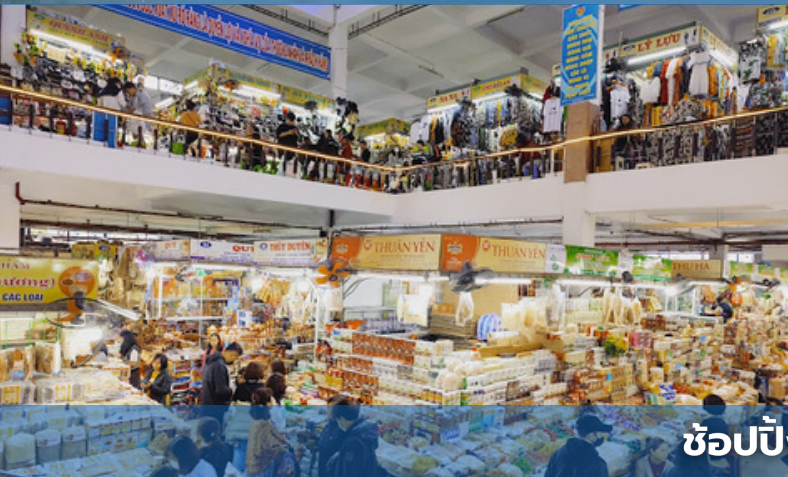
ช้อปปิ้งตลาดฮาน