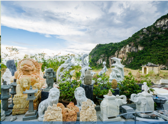
หมู่บ้านหินอ่อน