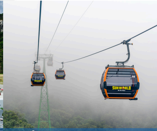
ขึ้นกระเช้าบานาฮิลล์