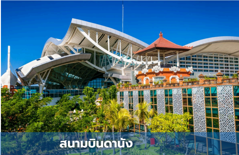
สนามบินดานัง