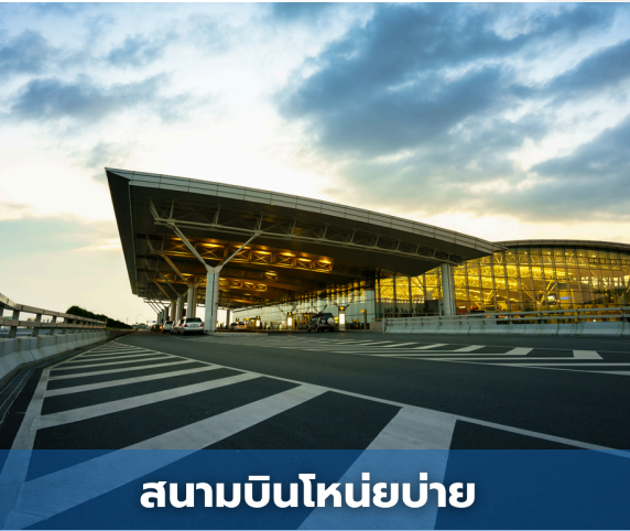
สนามบินนอยบาย