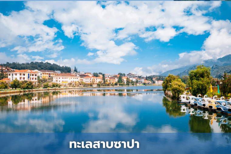
ทะเลสาบซาปา