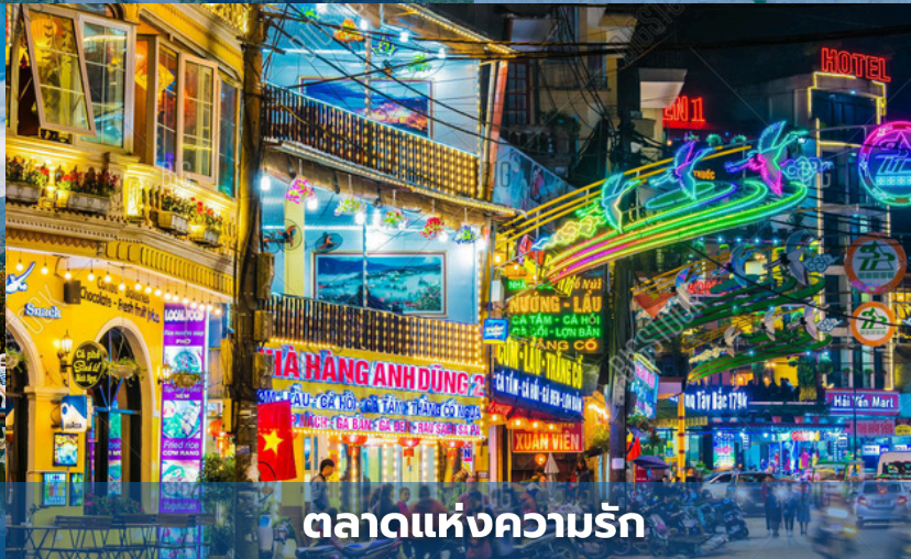
ตลาดแห่งความรัก