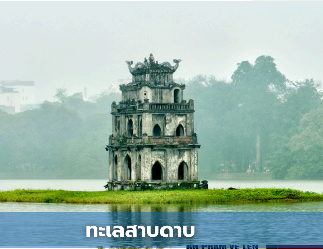
ทะเลสาบดาบ