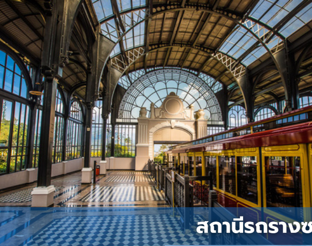
สถานีรางซาปา