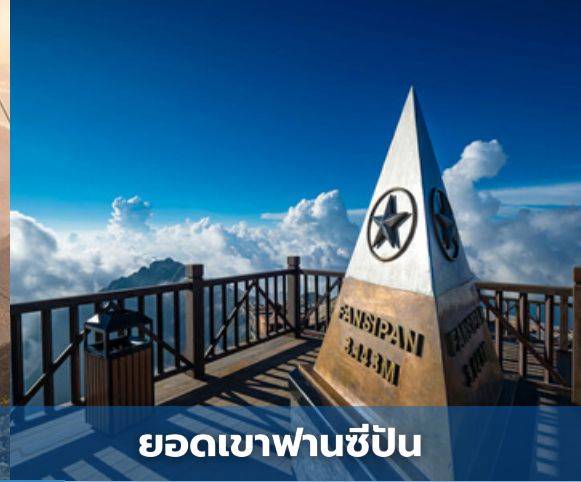
ยอดเขาฟานซีปัน