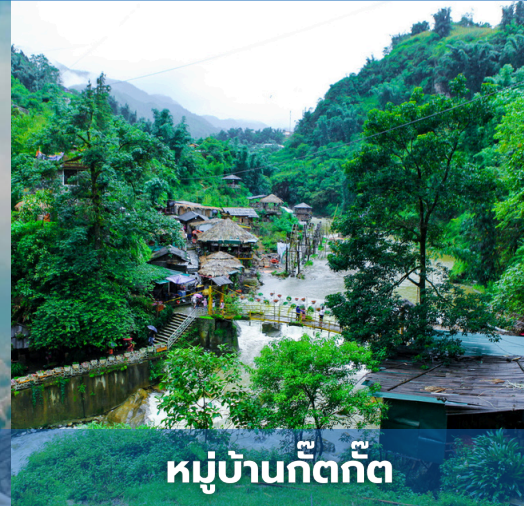
หมู่บ้านก๊ตก๊ต