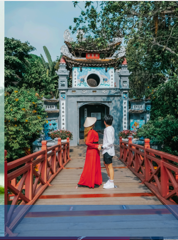
วัดหง็อกเซิน