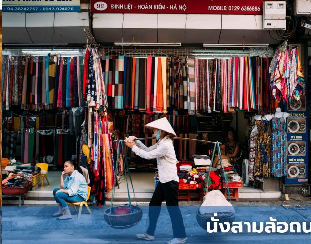
นั่งสามล้อถนนสายเก่าถนน 36