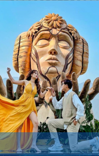
โมอาน่า ซาปา คาเฟ่