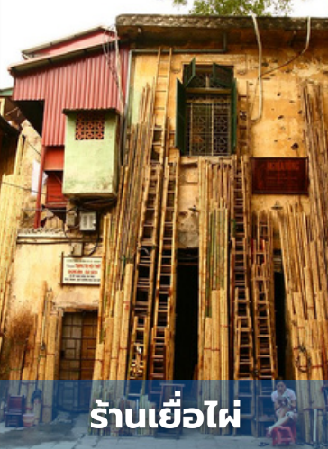
ร้านเยื่อไผ่