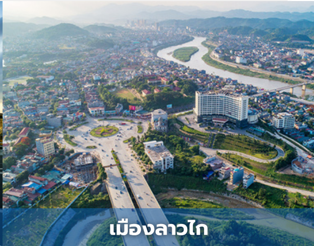
เมืองลาวไก