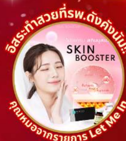
อิสระทำสวยที่พ.ดังคังนัม!! SKIN BOOSTER คุณงามความดี Let Me In

ชมจอ LED ขนาดยักษ์ที่รีสอร์ท 5 ดาว ใหญ่ที่สุดในเอเชียเหนือ ชมพระราชวังคยองบกคุง ย่านฮอนดัตหมู่บ้านบุคซอน ฮันอก ใส่ชุดฮันบก ทำข้าวห่อสาหร่าย อิสระช้อปปิ้ง Lotte Duty Free