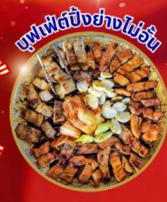
บุฟเฟ่ต์ปิ้งย่างไม่วัน