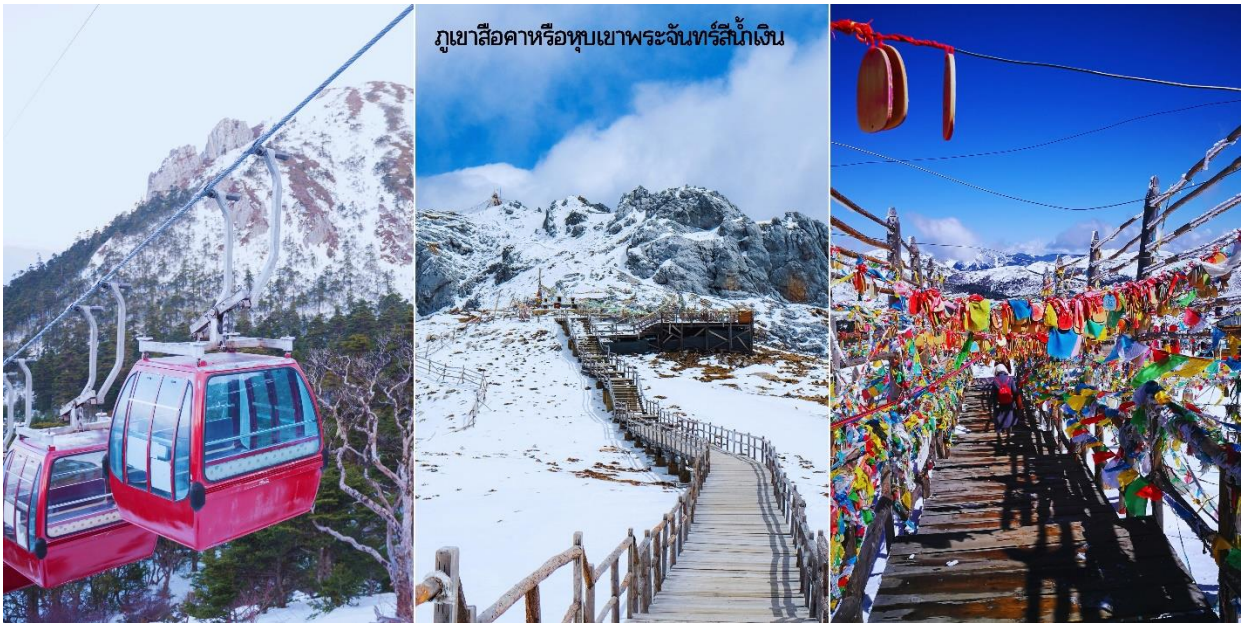
ภูเขาสี้อซ่าหรือหุบเขาพระจันทร์สีน้ำเงิน

URGENT! เส้นทางนี้...เดินทางสู่พื้นที่สูงมากกว่า 2,500 เมตรจากระดับน้ำทะเล เนื่องจากมีความดันอากาศและออกซิเจนลดลง อาจเกิดการแพ้ที่ราบสูงได้ หากมีอาการกรอกรับแจ้ง ไกด์หรือหัวหน้าทัวร์