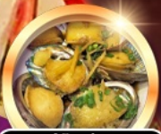
เมนูซีฟู้ดลิ้นจี่