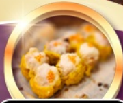
ต้มซ่าต้นตำรับ