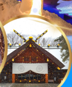
ศาลเจ้า ออกโทโต