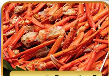
บุฟเฟ่ต์ขาปูยักษ์

ฟรีเดย์โตเกียว 1 วัน อิสระ ช้อปปิ้งหรือช้อปปิ้งทัวร์เสริมดั่งสนีย์แลนด์ 27 ธ.ค. - 01 ม.ค. 2568