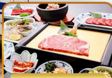
ปิ้งย่างร้านดัง ROKKASEN