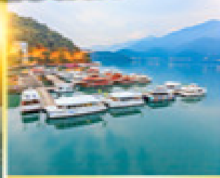
ทะเลสาบสุรียันจันตรา