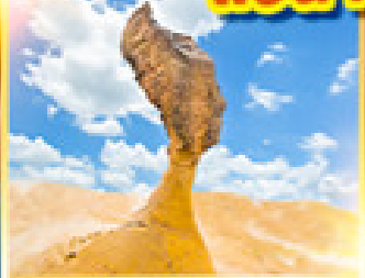
อุทยานเหย่หลิว

เที่ยวเต็ม!! ไม่มีวันอิสระ แช่น้ำแร่ในห้องพักส่วนตัว