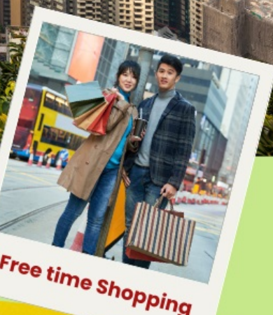
Free time Shopping