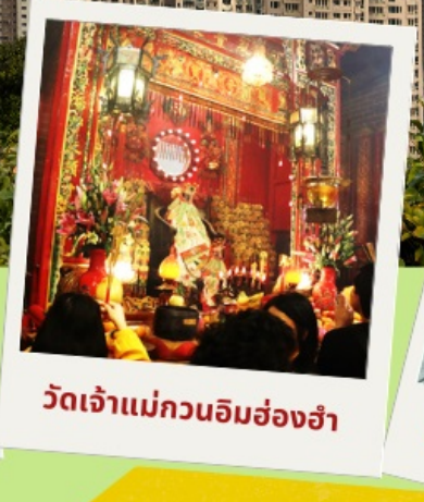
วัดเจ้าแม่กวนอิมฮ่องกง