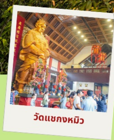
วัดแชกงหมิว