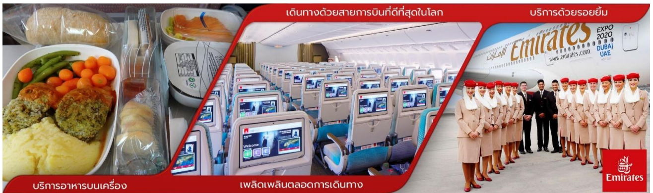
บริการอาหารบนเครื่อง

23.30 น. คณะพร้อมกันที่ สนามบินสุวรรณภูมิ ชั้น 4 บริเวณเคาน์เตอร์ T สายการบินเอมิเรตส์ EMIRATES AIRLINE (EK) โดยมีเจ้าหน้าที่ของทางบริษัทฯ คอยต้อนรับ และอำนวยความสะดวกด้านเอกสาร ออกบัตรที่นั่งและโหลดสัมภาระในการเดินทาง