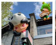
ถนนคนเดินชอยกว้างแอก