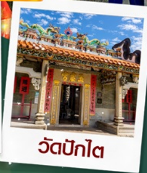
วัดปึกโต