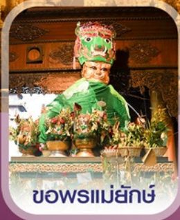
ขอพรแม่ยักษ์

✈️ คอนเฟิร์มออกเดินทาง ทุกพีเรียด 2 ท่านขึ้นไป