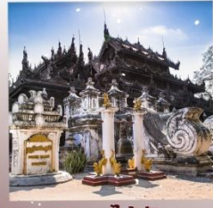
วิหารไม้สัก เขตตานจอง