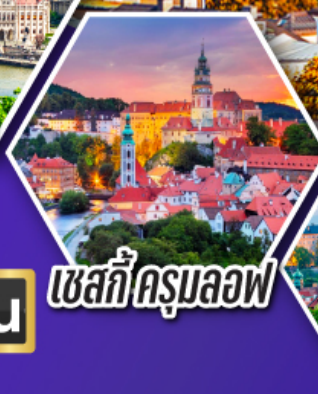
เซสกีครุมลอฟ