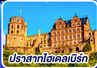
ปราสาทไอเดิลเบิร์ก