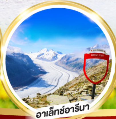
อาเล็กซ์อาร์นา