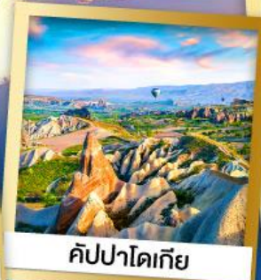
คัปปาโดเกีย