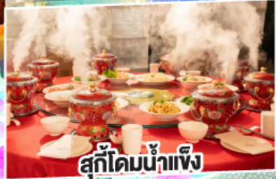
สุกี้ไต้มน้ำแข็ง