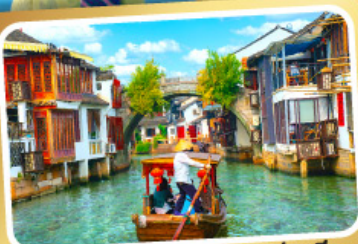
ล่องเรือเมืองโบราณซูเจียเจียว