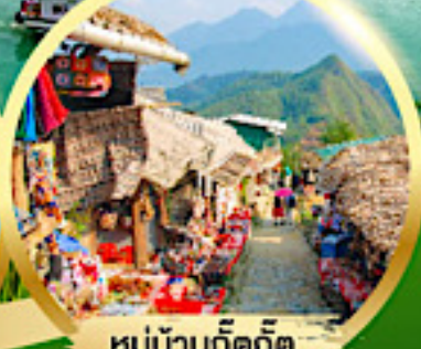
หมู่บ้านก๊ตก๊ต