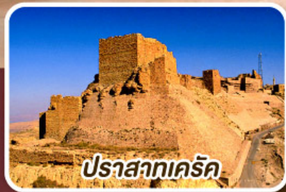
ปราสาทเคิร์ค