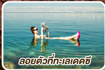
ลอยตัวที่ทะเลเดดซี