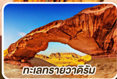
ทะเลทรายวาดีรัม