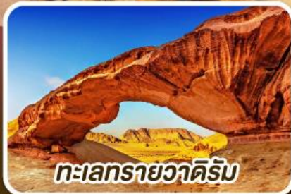
ทะเลทรายวาดีรัม