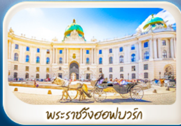
พระราชวังฮอฟบวร์ก

12-18 มี.ค.68 / 19-25 มี.ค.68 28 เม.ย. - 4 พ.ค.68 7-13 พ.ค.68