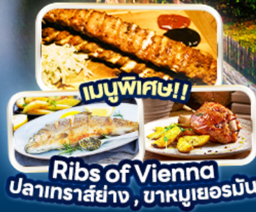
Rib's of Vienna ปลาเทราต์ย่าง, บาหมูเยอรมัน