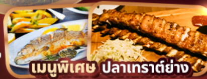
เมนูพิเศษ ปลาเทราต์ย่าง Rib of Vienna (1 rack 500g)