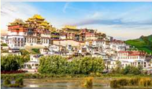
วัดลามะชงจ้านหลิน