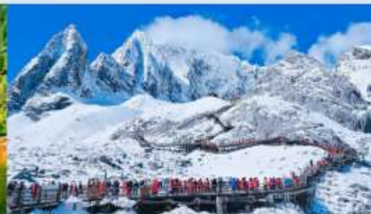
ภูเขาหิมะมิงกรหยก