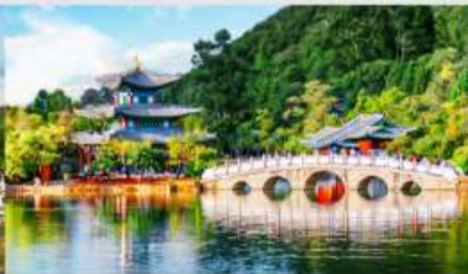
สระมิงกรดำ