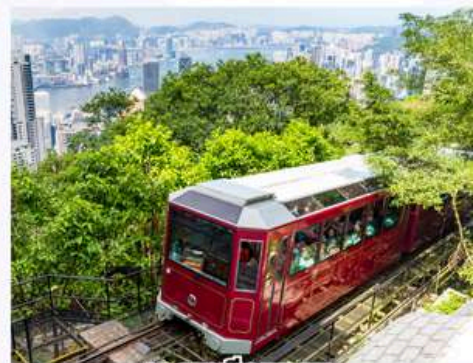
รถรางพิกแรม