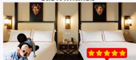
พัก Disney Explorers Lodge 5 ดาว 1 คืน