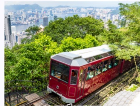
รถรางพิกแตรม