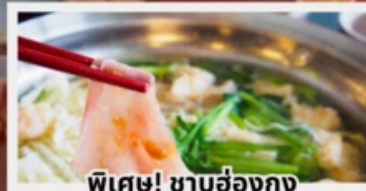
พิเศษ! ซาบูฮ่องกง

พักรูในดิสนีย์แลนด์ 1 คืน พร้อมบัตรเครื่องเล่นแบบจุใจ