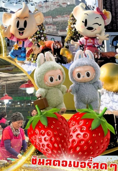
ชิมสตอเบอร์รี่สด ๆ จากไร่