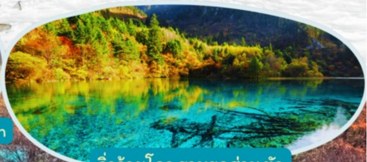
จิวจ้ายโกว รวมรถส่วนตัว