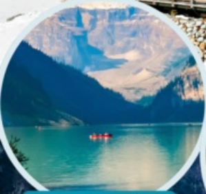
ทะเลสาบเตี้ยซี