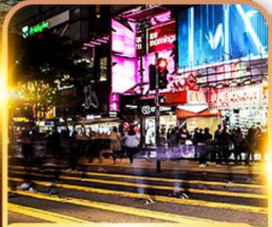
ซ้อปบั้ง Tsim Sha Tsui