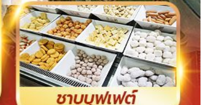
ชาบูบุฟเฟ่ต์