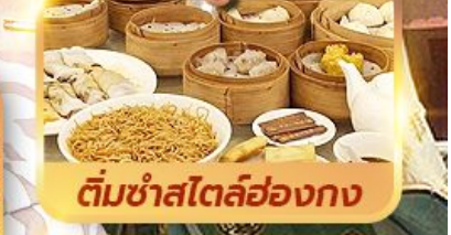
ติ่มซำสไตล์ฮ่องกง