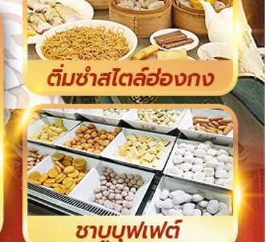
ติ่มซำสไตล์ฮ่องกง