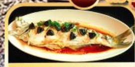
ปลาประจักษ์ริบตี