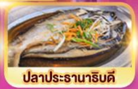
ปลาประธาราธิบดี