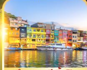
ตึกหลากสีเจินปิง