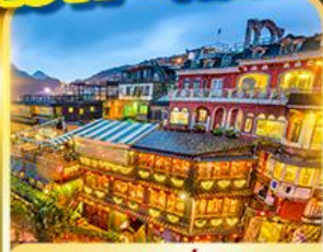
หมู่บ้านจิวเฟิน