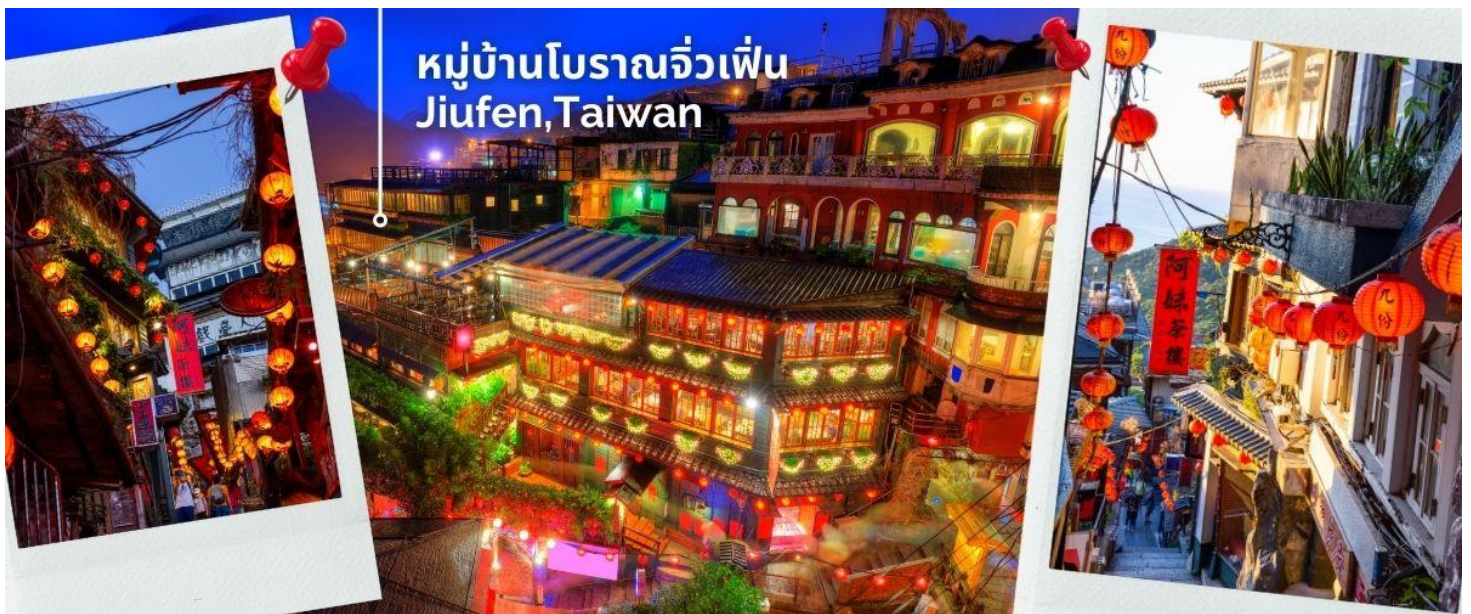
หมู่บ้านโบราณจิวเฟิ่น Jiufen, Taiwan

นำทุกท่านเดินทางไปสู่สัมผัสบรรยากาศ หมู่บ้านโบราณจิวเฟิ่น ที่ตั้งอยู่บริเวณไหล่เขาในเมืองจีหลง หมู่บ้านจิวเฟิ่น เคยเป็นแหล่งเหมืองทองที่มีชื่อเสียงตั้งแต่สมัยโบราณ ปัจจุบันเป็นสถานที่ท่องเที่ยวที่สำคัญแห่งหนึ่ง เพราะเป็นถนนคนเดินเก่าแก่ที่มีชื่อเสียงที่สุดในไต้หวัน ให้ท่านได้เพลิดเพลินบรรยากาศแบบดั้งเดิมของร้านค้า ร้านอาหารของชาวไต้หวันในอดีตและยังสามารถชื่นชมวิวทิวทัศน์รวมทั้งเลือกชิมและซื้อชาจากร้านค้าที่มีอยู่มากมายอีกด้วย *เสาร์-อาทิตย์ ต้องเปลี่ยนเป็นรถสาธารณะ