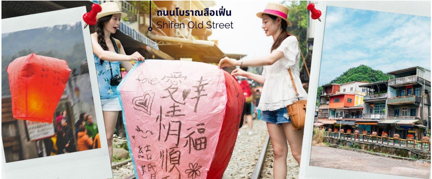
ถนนโบราณสี่เฟิ่น Shifen Old Street

จากนั้นนำท่านไป ถนนโบราณสี่เฟิ่น (Shifen Old Street) เป็นชุมชนเล็กๆ ริมหางรถไฟสายเก่าของสายรถไฟผิงซี (Ping xi Line) ถนนแห่งนี้เป็นชุมชนเก่าแก่ที่เมื่อก่อนเป็นเส้นทางลำเลียงถ่านหินสมัยที่ญี่ปุ่นยึดครองไต้หวัน นักท่องเที่ยวนิยมมาปล่อยโคมลอยกระดาษ เมื่อซื้อโคมไฟก็มีการเขียนความปรารถนาที่จะอธิษฐาน และปล่อยขึ้นท้องฟ้า และสนุกกับการเดินเล่นไปตามรางรถไฟ มีร้านอาหารและโปสการ์ดให้เลือกซื้อ ร้านขายงานฝีมือผลิตภัณฑ์โคมไฟ (รวมค่าบริการปล่อยโคมลอย 1 โคม / 4 ท่าน)