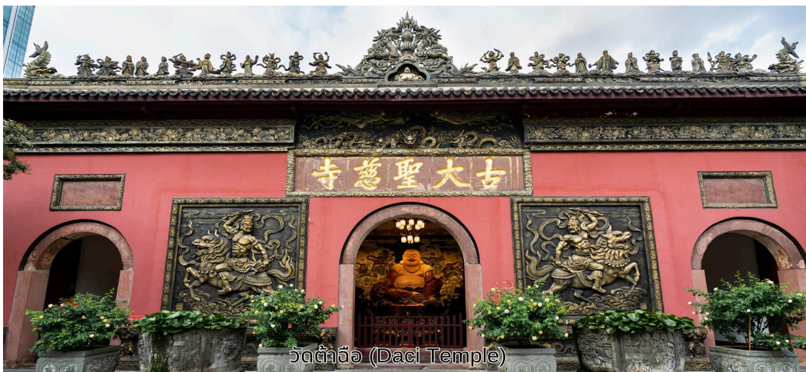
วัดต้าจื่อ (Daci Temple)

บ่าย จากนั้นเดินทางไปยัง วัดต้าจื่อ เป็นวัดเก่าแก่ที่มีอายุยาวนานกว่า 1,600 ปี ตั้งอยู่ใจกลางของ Chengdu ที่นี่ถือเป็นสถานที่สำคัญที่น่าสนใจ เพราะเป็นวัดที่พระถังซำจั๋งบวชเป็นพระภิกษุก่อนจะย้ายไปจำพรรษายังวัดอื่นภายในวัดต้าจื่ออันเจียบสงบ จากนั้นนำท่านสู่ ถนนคนเดินชุนซีลู่