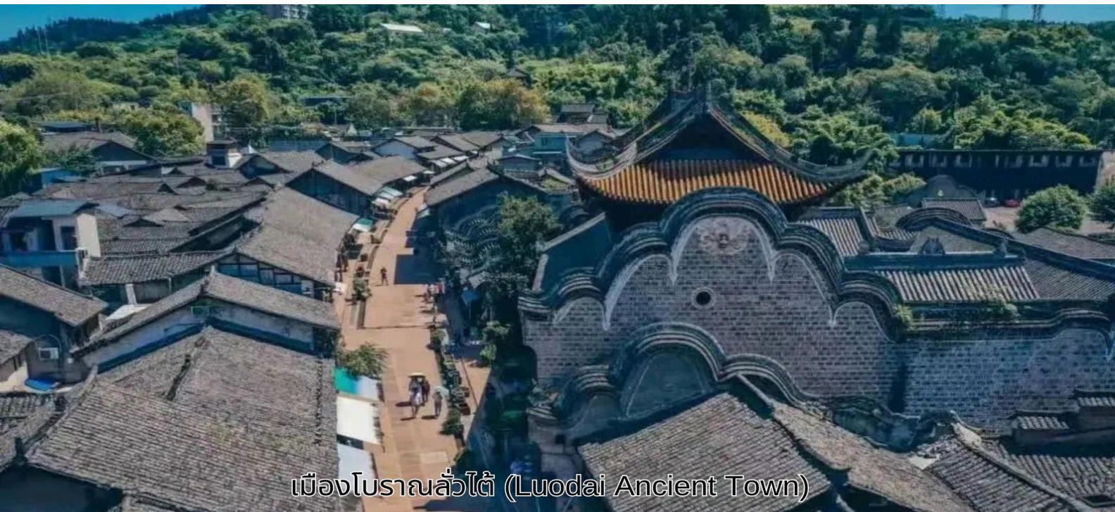
เมืองโบราณลั่วไต (Luodai Ancient Town)