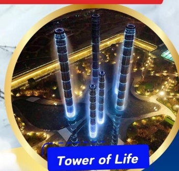
Tower of Life