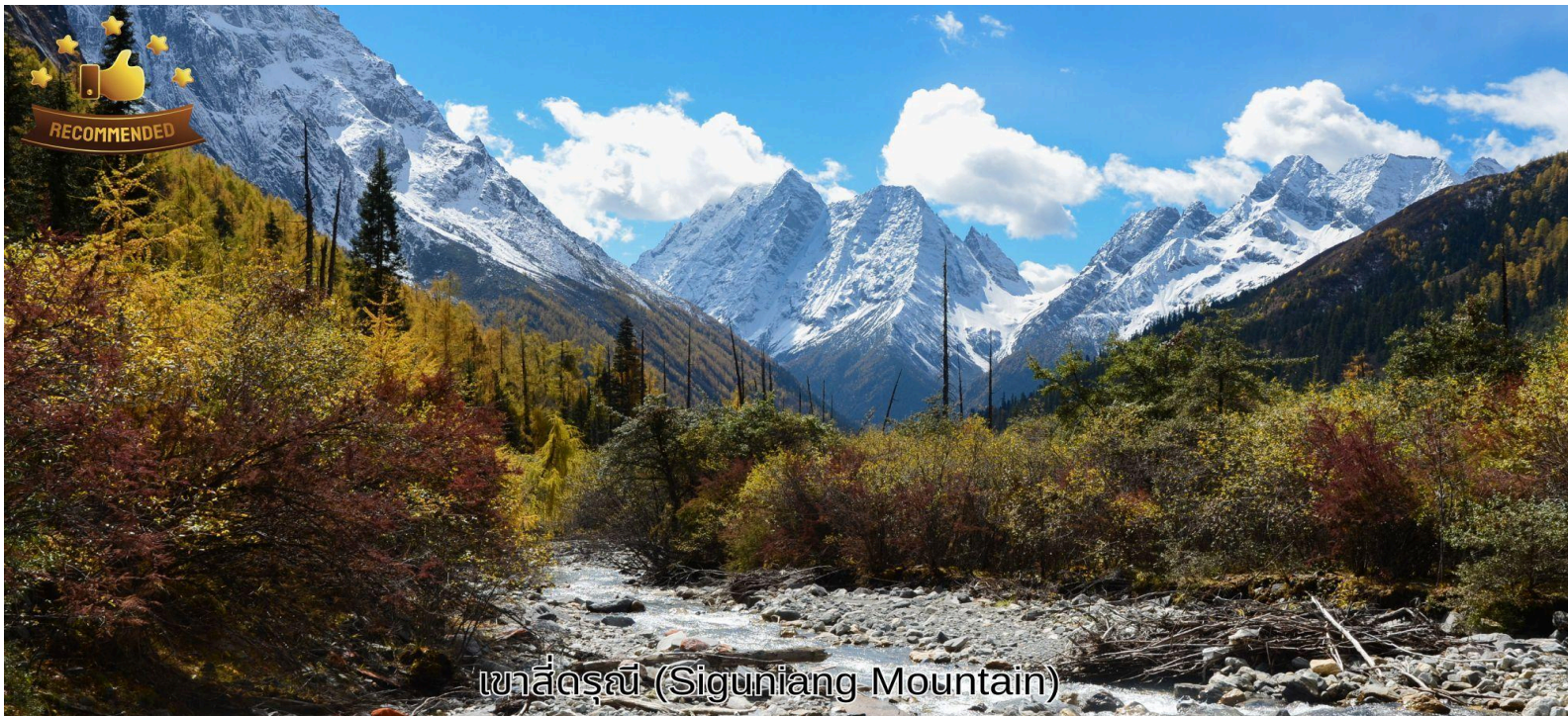
เขาสีดรุณี (Siguniang Mountain)