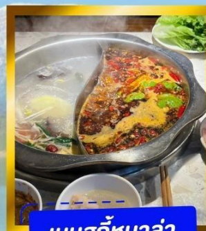
เมนูสุกัหมาล่า