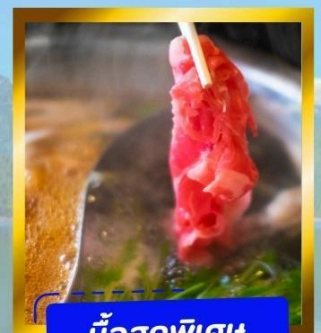
มือสุดพิเศษ