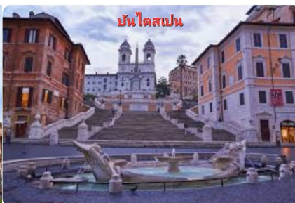
บันไดสเปน