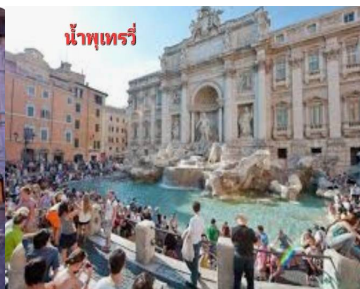
น้ำพุเทร่