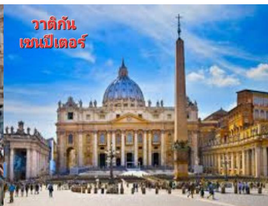
วาติกัน เซนต์ปีเตอร์