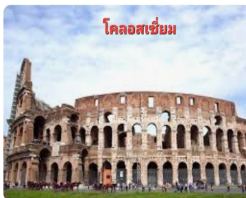
โคลอสเซียม