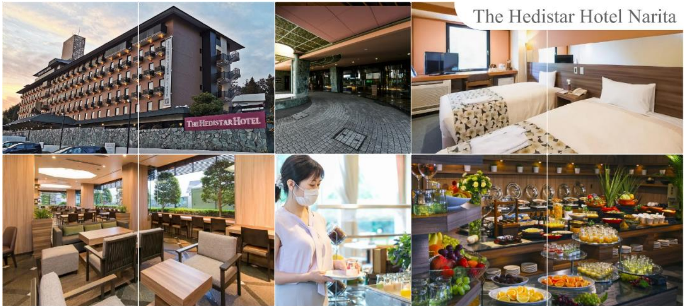
The Hedistar Hotel Narita