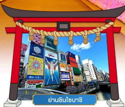
ย่านชินไซบาชิ