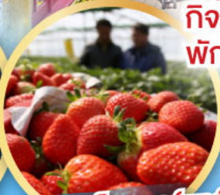
กิจกรรมเก็บสตอร์วเบอร์รี่

เดินทาง 09-13, 16-20, 23 -27 ม.ค.68 06-10,13-17, 20-24 ก.พ. 68 07-10 มี.ค. 68